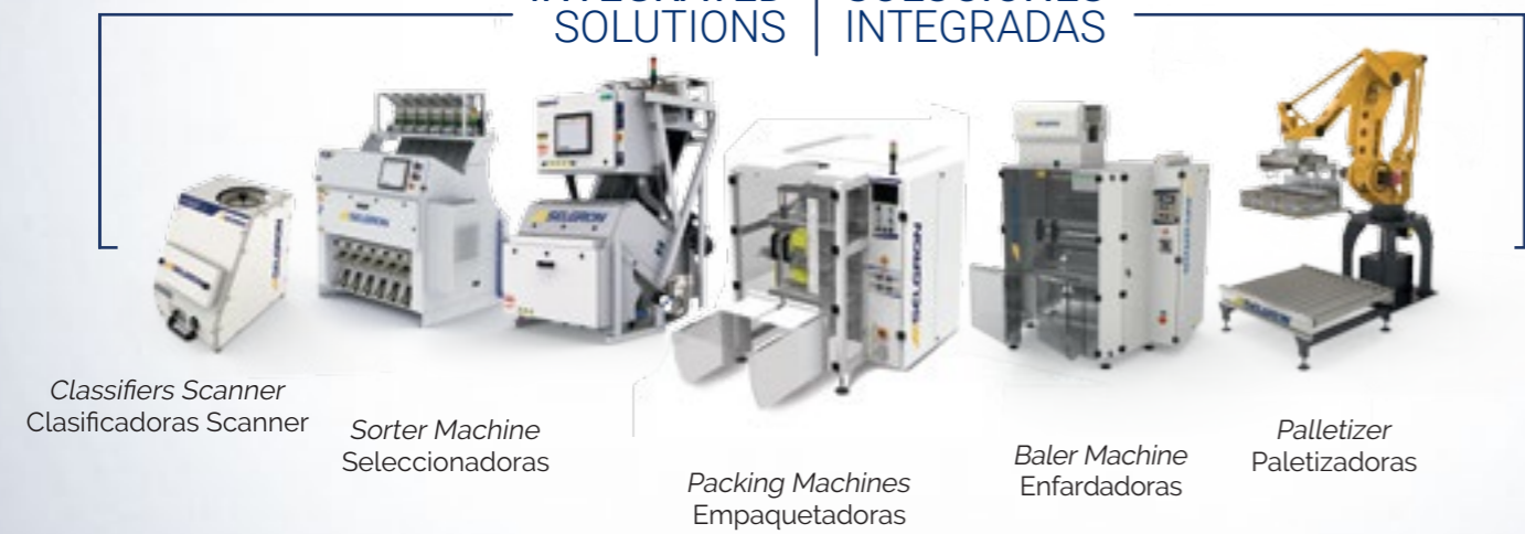
Classifiers Scanner Clasificadoras Scanner